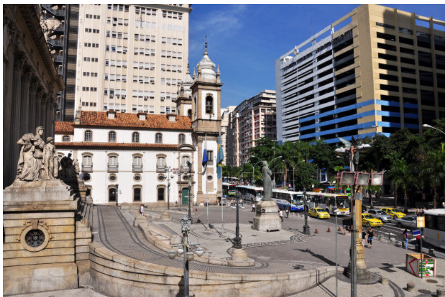
Palácio Tiradentes: escadaria será palco para encenação teatral

A escadaria da Assembleia Legislativa, na Praça XV, Centro do Rio, será palco de uma encenação teatral que vai reconstituir o enforcamento de Tiradentes. Com texto e direção de Alexei Waichenberg e Maria Nattari, a peça “Tiradentes – Nem tudo o que parece é” faz parte do projeto Porto de Memórias 2015.