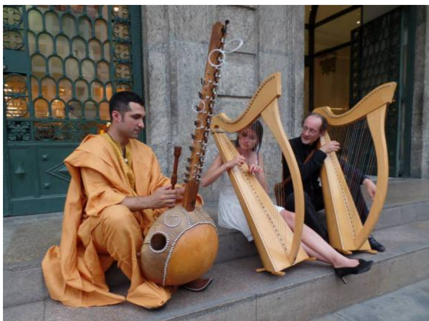
— RIO HARP FESTIVAL – Divulgação

Entre 29/04 e 31 de maio, o Rio vai receber o XI RioHarpFestival , evento internacional de harpas, que está em sua décima-primeira edição.